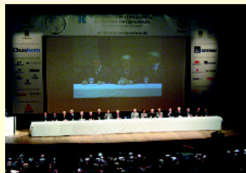
FIERGS - Teatro do Sesi

Congresso Internacional da Gestão da Qualidade “Os Segredos do Futuro” & 42ª Reunião de Qualidade RS