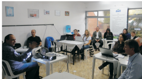
CAPACITAÇÃO: abordou nova ferramenta