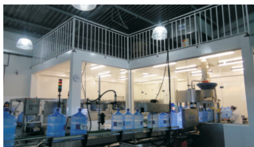
PROTEÇÃO: guarda corpos dão mais segurança

Dando sequência ao processo de adequação da Itati ao Sistema de Análise e Pontos Críticos de Controle (APPCC), novas melhorias foram implantadas na área Industrial. Em maio, foram instalados divisores físicos, atendendo à solicitação da Agência Nacional de Vigilância Sanitária (Anvisa). No final de julho, a plataforma de estoque de insumos ganhou guarda corpos, ampliando a proteção e segurança dos colaboradores e clientes. As mudanças atendem as Boas Práticas de Fabricação de Produtos, em conformidade com a legislação do setor.