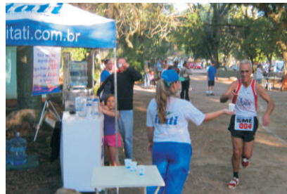
PARCÃO: atletas hidratados com a Itati

Em mais uma etapa do Campeonato de Rústicas da Redenção, no Parque Ramiro Souto, em Porto Alegre, a Itati possibilita a prática de exercícios aliada à constante hidratação. Parceira da secretaria de Esporte, Recreação e Lazer da Capital, forneceu água mineral aos