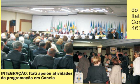
INTEGRAÇÃO: Itati apoiou atividades da programação em Canela

Apoiando as atividades do Rotary Internacional, a Itati se fez presente na 53ª Conferência do Distrito 4670, no Hotel Continental em Canela, entre 13 e 15 de maio. Considerado o maior acontecimento do ano rotário, o evento proporcionou a troca de experiências entre as organizações, contando com palestras e exposições sobre as