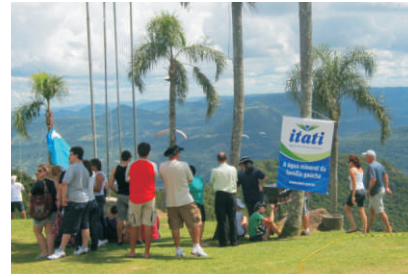
PROVAS: atletas reuniram-se em Nova Petrópolis

Centenas de pessoas participaram no dia 13 de março, do 5º Gaúcho de Parapente e Asa. O evento, ocorrido no Ninho das Águias, em Nova Petrópolis, premiou os 30 melhores da competição. Durante as provas, os presentes puderam saborear a água mineral Itati. Os