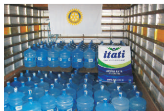
GARRAFÕES: enviados à São Lourenço

Cento e trinta e seis bombonas de Água Mineral Itati foram enviadas, em ação conjunta com o Rotary Clube Industrial de Canoas, aos desabrigados de São Lourenço do Sul. O forte temporal que abalou o litoral sul do Estado, ocorreu na madrugada de 9 de março. Os 2.720 litros de água mineral - doados pela comunidade, com envase gratuito da empresa foram entregues, no dia 14 de março, juntamente com outros donativos, pelos rotarianos do município, com apoio do caminhão do Banco de Alimentos de Porto Alegre.