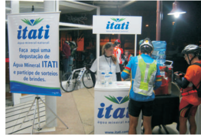
APOIO: água mineral à disposição dos atletas

A Itati esteve presente nas provas de ciclismo promovidas pelo Clube Audax de Porto Alegre (CAPA). Ao longo do ano serão sete corridas em preparação para o Audax no mundo, que ocorrerá na França, em 7 de agosto, com percurso de 1,2 mil quilômetros.