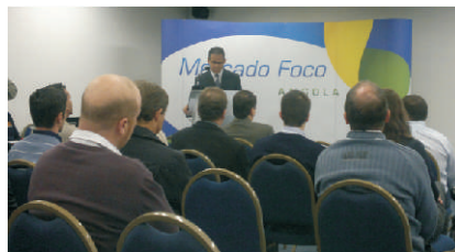
APEX: em foco o mercado de Angola

Dentro do seu projeto de internacionalização, a Itati participou, no dia 5 de maio, do Seminário Apex - Mercado Foco Angola e, em 16 de maio, do Workshop dos setores de Alimentos e Bebidas no Brasil. Os eventos ocorreram na FIERGS, em Porto Alegre.