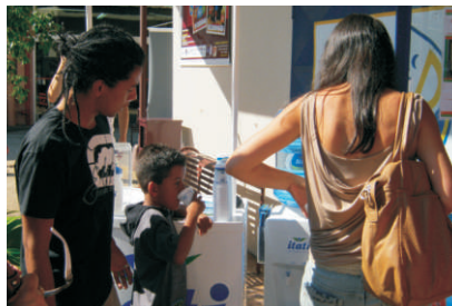
NOVO DC: espetáculos em família

de violência física ou psicológica contra crianças e adolescentes.