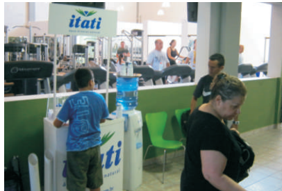
EXERCÍCIOS: acompanhados de água mineral

No dia 7 de abril, a Itati esteve na nova sede da Mapi Academia (rua Dom Pedro II, bairro Nossa Senhora das Graças) para degustação de água mineral. Durante a visita, alunos e funcionários puderam conhecer mais sobre o produto, além dos projetos da Empresa.