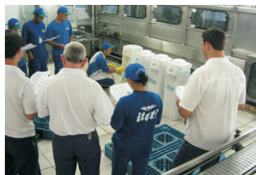
ESTUDO: colaboradores revisam rotinas

Entre janeiro e abril deste ano, os colaboradores da área Industrial, Administrativa e de Portaria participaram de 163 horas de treinamentos realizados por meio dos Procedimentos Operacionais Padrão. O uso desta ferramenta de qualidade possibilita que as equipes estejam constantemente capacitadas para o desempenho de suas funções. Os procedimentos são voltados tanto para entrada de novos colaboradores como para reciclagem dos antigos, que estudam juntos as atividades a serem desenvolvidas.