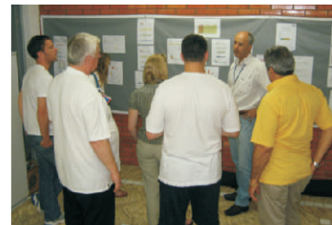
ESPECIALISTAS: conheceram projetos

Quatro especialistas em Meio Ambiente, do Programa de Intercâmbio de Grupo de Estudo (IGE), da Fundação Rotária, conheceram as instalações da Itati em 29 de abril. A visita técnica possibilitou o intercâmbio de experiências na área, na qual a empresa destaca-se em projetos de manejo e reciclagem de resíduos. Durante o encontro, o grupo acompanhou o processo de extração até o engarrafamento da água mineral, trocando ideias sobre o exercício das atividades.