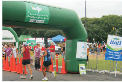
CORRIDA: marcou festejos da Semana da Capital