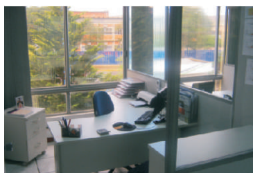
CONFORTO: espaços próprios às equipes

Atendendo às solicitações dos relatórios de não conformidades, sugeridas por colaboradores, a direção promoveu mudanças na planta Administrativa da Itati. O novo layout previu salas próprias para a Coordenação da Qualidade e Merchandising, proporcionando melhorias na estruturação do trabalho, assim como um espaço adequado para realização de atividades com isolamento e conforto térmico. A alocação dos espaços foi finalizada em maio.