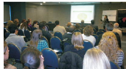
WORKSHOP: abordou alimentos e bebidas