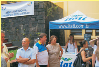
ENCONTRO: rotarianos no Colégio Sinodal

Nos dias 13 de março e 30 de abril, os rotarianos reuniram-se no Colégio Sinodal, em São Leopoldo, para seminário e assembleia distrital, respectivamente. E como não podia faltar, a Itati atendeu os presentes em estande próprio, fornecendo água e entregando brindes. Os encontros também contaram com treinamentos e apresentações sobre projetos realizados pelas entidades.